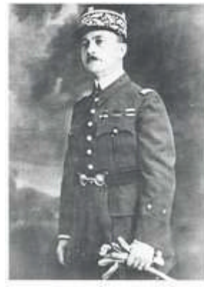
Charles Delestraint.

Ce plan audacieux mais cohérent est accepté sous l'appellation "plan Montagnards" par les chefs de la France libre, Jean Moulin et le délégué militaire Delestraint. Il est évident que l'apport matériel des Alliés est, dans cette perspective, nécessaire, comme il l'est partout.