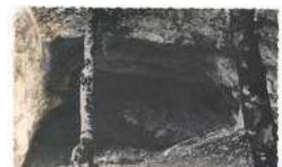
Saint-Agnan-en-Vercors (Drôme), la Loire.