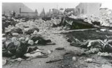
Vassieux-en-Vercors (Drôme), juillet 1944.

Chavant a télégraphié sa rage à Alger, traitant de “criminels et de lâches” les responsables qui n’ont pas tenu leurs engagements. À partir du 23, les survivants tentent de fuir le plateau par petits groupes, de “nomadiser” pour échapper à la répression sauvage. À la grotte de la Luire, à Vassieux, à La Chapelle, les Allemands se livrent à des atrocités sur les maquisards pris, sur les civils aussi, faisant huit cent quarante victimes, détruisant les villages. Le gros du repli n’a été possible que par le sud-est, vers le Trièves via le Haut-Diois. Plusieurs jours après la bataille, l’écrivain Jean Prévost, “capitaine Goderville” dans la Résistance, est pris et tué alors qu’il tente de descendre sur Sassenage.