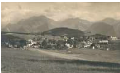
Saint-Nizier-du-Moucherotte, juin 1944.

Le Vercors est donc devenu ce qu'il ne devait surtout pas être : une forteresse assiégée. Les Allemands ne peuvent pas supporter cette provocation, cette concentration sur leurs arrières. Dès le 13 juin, ils tentent une attaque sur Saint-Nizier, brillamment repoussée. Mais le 15, ils reviennent en force et investissent le plateau, poussant les maquisards à se replier sur le centre du massif. Le constat a été fait que la "forteresse" avait en fait de multiples voies d'accès que les résistants ne pouvaient pas toutes tenir. L'attaque surprise et tragique sur le groupe de Malleval, en janvier 1944, avait montré (trente morts) la sauvagerie de la répression allemande. L'angoisse monte. Certes, le massif est un morceau de territoire libéré, proclamé le 3 juillet "République du Vercors", dans une ferveur qui donne le frisson. Dans l'enthousiasme, on envisage même de faire parachuter de Gaulle en personne ! Le parachutage d'armes du 14 juillet, dont la symbolique des parachutes bleus, blancs et rouges est forte, entretient l'espoir, mais manque toujours les mortiers, les armes lourdes alors que les avions allemands venus de Chabeuil bombardent le plateau juste après le parachutage.