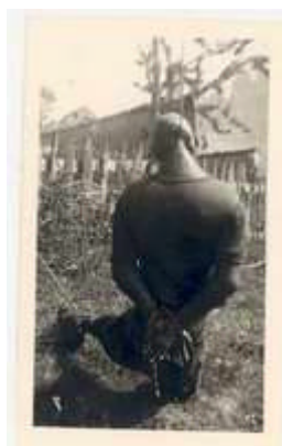
Vassieux-en-Vercors (Drôme), La Mure, juillet 1944. Maquisard pendu par les Allemands.