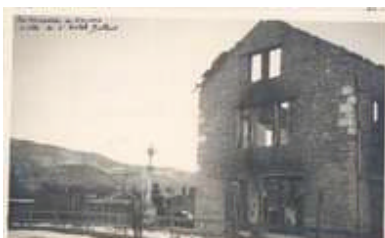
La Chapelle-en-Vercors, juillet 1944.