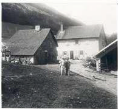
La ferme d'Ambel, Omblèze (Drôme), vers 1930