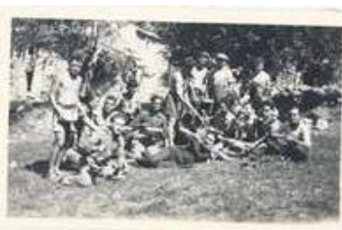
Vercors 1944.