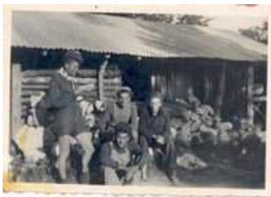
Autrans, les Carteaux, 1943. Maquisards du C3.

Avec l'annonce du débarquement en Normandie, c'est une véritable levée en masse. Alors que les différents camps contiennent environ quatre cents maquisards, on compte plus de trois mille cinq cents volontaires le 9 juin, maquisards sédentaires qui attendent le jour J, rejoints par de nombreux jeunes aussi enthousiastes que peu équipés. Mais le parachutage massif de troupes américaines ne vient pas. Le débarquement, certes réussi mais pas encore décisif, reste la priorité. Les Alliés ne peuvent ou ne veulent pas engager cinq mille hommes au Vercors et le débarquement en Provence n'est pas prévu dans l'immédiat.