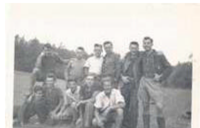
Vassieux-en-Vercors (Drôme), col de Lachau, juillet 1943. Maquisards du C6.

Le Vercors est donc devenu ce qu'il ne devait surtout pas être : une forteresse assiégée. Les Allemands ne peuvent pas supporter cette provocation, cette concentration sur leurs arrières. Dès le 13 juin, ils tentent une attaque sur Saint-Nizier, brillamment repoussée. Mais le 15, ils reviennent en force et investissent le plateau, poussant les maquisards à se replier sur le centre du massif. Le constat a été fait que la "forteresse" avait en fait de multiples voies d'accès que les résistants ne pouvaient pas toutes tenir. L'attaque surprise et tragique sur le groupe de Malleval, en janvier 1944, avait montré (trente morts) la sauvagerie de la répression allemande. L'angoisse monte. Certes, le massif est un morceau de territoire libéré, proclamé le 3 juillet "République du Vercors", dans une ferveur qui donne le frisson. Dans l'enthousiasme, on envisage même de faire parachuter de Gaulle en personne ! Le parachutage d'armes du 14 juillet, dont la symbolique des parachutes bleus, blancs et rouges est forte, entretient l'espoir, mais manque toujours les mortiers, les armes lourdes alors que les avions allemands venus de Chabeuil bombardent le plateau juste après le parachutage.