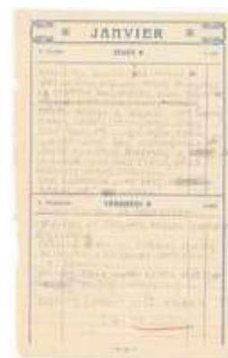
Texte manuscrit d'un télégramme d'André Pecquet "Paray", officier américain de renseignement, adressé à Londres, attestant de la répression allemande en Vercors. Vercors, 12 août 1944. Coll. MRDI